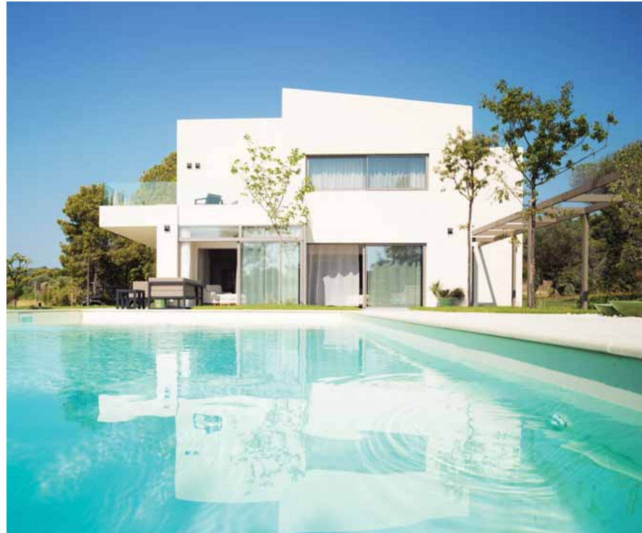
Остров Диапорос | Греция