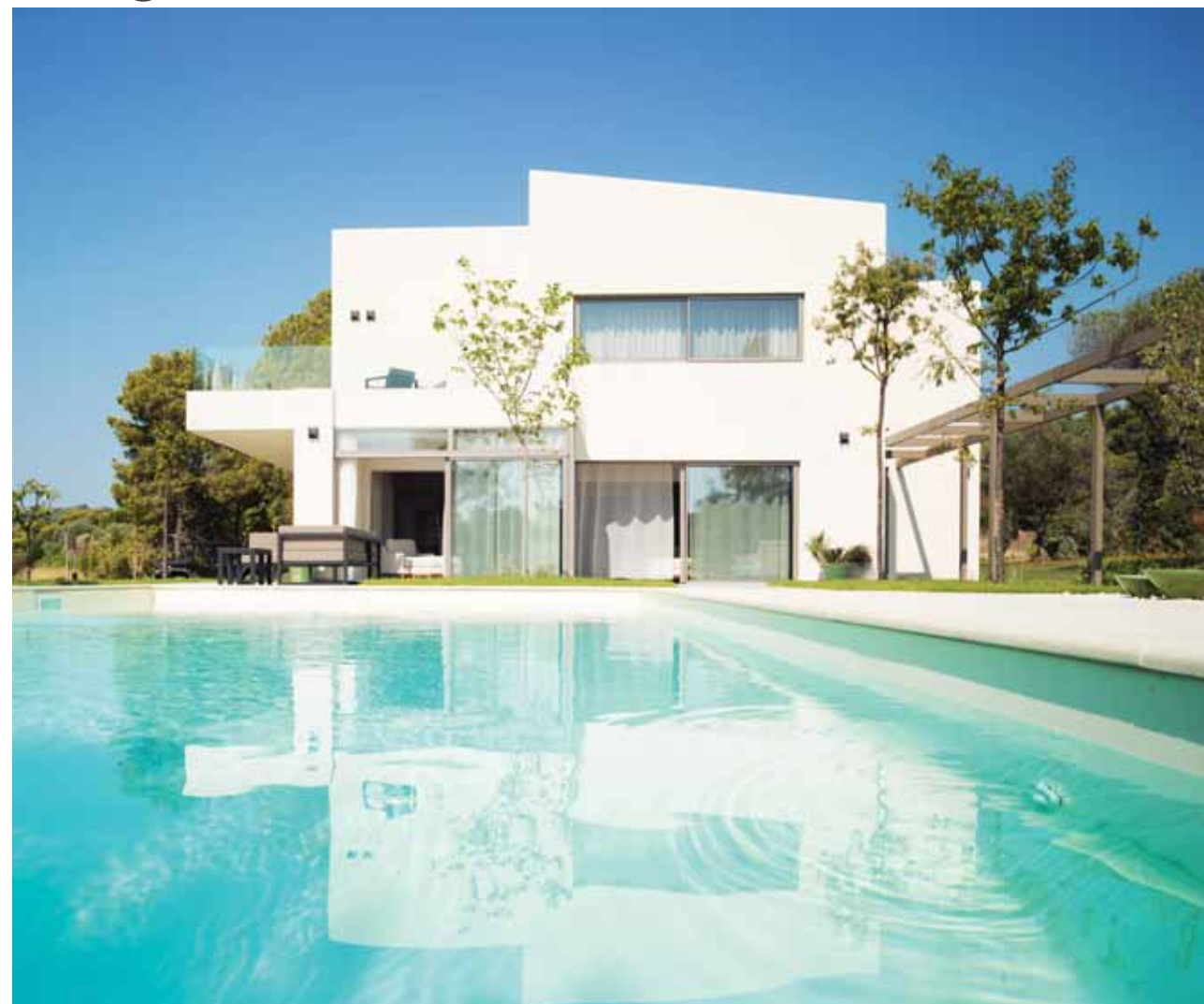
Остров Диапорос | Греция